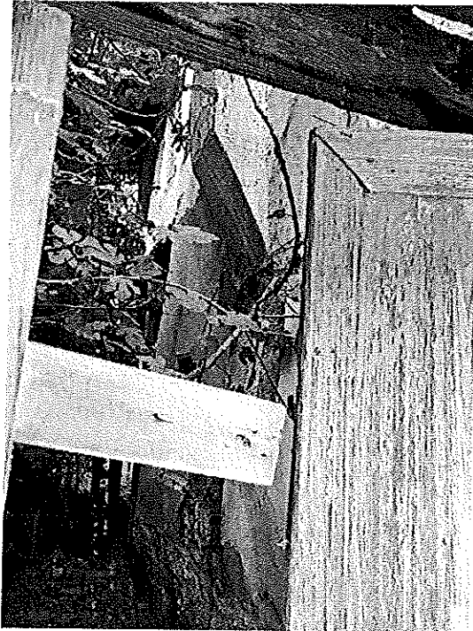
Φωτ. 4 Η εσωτερική αυλή καπηλευμένη από φυτεύσεις και οικοδομικό υλικό