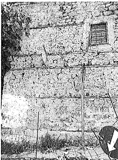
Φωτ. 3 Λεπτομέρεια της πρόσοψης

Πρόκειται ουσιαστικά για οικοδομικά υπολείμματα του κτίσματος εφόσον αυτό είναι εγκαταλειμμένο και έχει καταρρεύσει σε μεγάλο μέρος του. Η στέγη έχει εξολοκλήρου καταρρεύσει και η εναπομείνασα εξωτερική τοιχοποιία φέρει έντονα σημάδια αποσάθρωσης στα κονιάματα και τη λιθοδομή της. Κατακόρυφες ρωγμές εντοπίζονται σε διάφορα σημεία και αποσύνθεση όλου του υλικού δόμησης. Τα μέτρα προστασίας που έχουν εφαρμοστεί βρίσκονται επίσης σε κακή κατάσταση διατήρησης και η γενικότερη συνθήκη κινητικότητας στο συγκεκριμένο σημείο είναι ιδιαίτερα επικίνδυνη για πεζούς και οχήματα λόγω της κλίσης της οδού αλλά και της χάραξής της στο σημείο. Ήτοι ελλοχεύει μεγάλος κίνδυνος τα μέτρα να μην γίνονται αντιληπτά έγκαιρα από τα οχήματα θέτοντας σε κίνδυνο την ασφάλεια των πεζών.