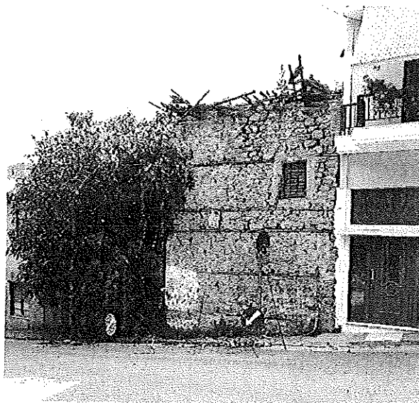
Φωτ. 2 Η όψη του κτίσματος επί της οδού Αφροδίτης

Η είσοδος στο εσωτερικό του κτίσματος ήταν αδύνατη λόγω της κακής κατάστασης διατήρησης του καθώς και γιατί ο υπαίθριος χώρος έχει καταληφθεί εξολοκλήρου από αυθαίρετες φυτεύσεις. Πρόκειται για διώροφο κτίσμα κατασκευασμένο από λιθοδομή με ξυλοδεσιές και ξύλινη στέγη. Στη θέση του κτίσματος έχουν εφαρμοστεί μέτρα αποτροπής της επικινδυνότητας και πιο συγκεκριμένα έχει τοποθετηθεί οικοδομικό μεταλλικό πλέγμα που στηρίζεται σε οικοδομικές μεταλλικές ράβδους καθώς και μη φωτεινό σήμα αποτροπής της κίνησης.